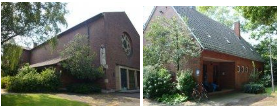
Neuen Lagerräume: Kirche und Pfarrhaus St. Barbara

Schon kurz nachdem wir im letzten Jahr die St. Paul Kirche als neues Lager bezogen hatten, wurde für das Kirchengebäude ein neuer Investor gefunden. Schon mussten wir unser frisch eingerichtetes Lager wieder verlassen. Unser Glück war, dass sich sofort ein neues Lager in den Räumen der ehemaligen St. Barbara Kirche einschließlich zugehörigem Pfarrhaus fand.