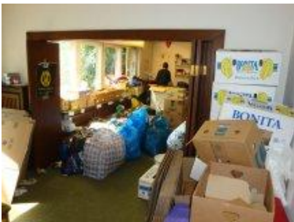
Hilfsgüter werden für den Versand vorbereitet

Hier finden wir hervorragende Bedingungen vor. Die große Kirche gibt uns Platz für die logistische Vorbereitung. Alle Hilfsgüter warten nun gut sortiert auf ihren Einsatz. Zudem bieten die Räume des Pfarrhauses ideale Bedingungen für die Konfektionierung der Hilfssendungen. Vor allem im Winter kann dies nun endlich in beheizten Räumen stattfinden – ein nicht zu unterschätzender Vorteil für unsere vielen freiwilligen Helfer.