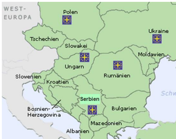
Ziele unserer Hilfstransporte in 2010

Seit 1990 sammeln und transportieren wir Hilfsgüter für die armen Länder Osteuropas. Dank der Hilfe einer stets wachsenden Zahl von Spendern wurden bis heute über 640 Transporte organisiert.