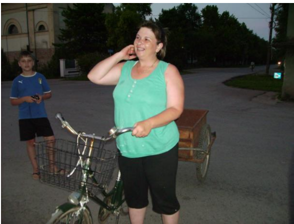
Eines unserer Spendenräder, mit Anhänger zu einem echten Transportfahrzeug erweitert.

Auch in 2010 haben wir über 300 Räder gesammelt. Die Räder gehen meist in die Region Vojvodina, wo sie für viele Menschen das einzige Transportmittel darstellen. Die Räder werden z.B. als „Dienstrad“ bei der häuslichen Pflege und als Transportrad für die Versorgung Alten- und Behindertenheimen verwendet.