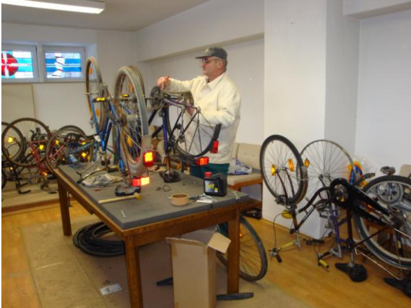
Vor dem Versand werden die Fahrräder überprüft und bei Bedarf generalüberholt.

Auch in 2010 haben wir über 300 Räder gesammelt. Die Räder gehen meist in die Region Vojvodina, wo sie für viele Menschen das einzige Transportmittel darstellen. Die Räder werden z.B. als „Dienstrad“ bei der häuslichen Pflege und als Transportrad für die Versorgung Alten- und Behindertenheimen verwendet.