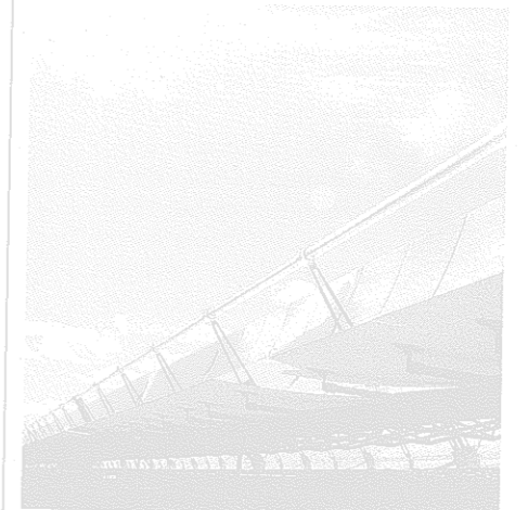
Öko: Solarthermisches Kraftwerk

Höppe bringt schon als Erstes Energie und Strom durcheinander. Von 100 Prozent verbrauchter Energie entfallen nur 20 Prozent auf Strom, der Rest fällt auf Kraft- und Heizstoffe. Da Desertec nur Strom liefern würde, wäre ihr Beitrag am europäischen Gesamtenergieverbrauch gerade 3 Prozent - und das für 400 Milliarden Euro? Wenn sich der Strompreis der Kraftwerke in den nächsten 10 Jahren nach Meinung Höppes verteuern sollte, dann in erster Linie wegen der Einspei-