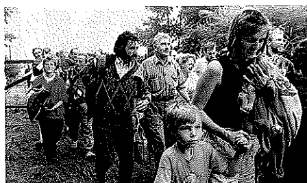
Flüchtende DDR-Bürger 1989 Ziemlich erschreckt

Nr. 22/2009, Ungarn: 20 Jahre Mauerfall – Die heimlichen Drahtzieher des Grenzdurchbruchs von Sopron